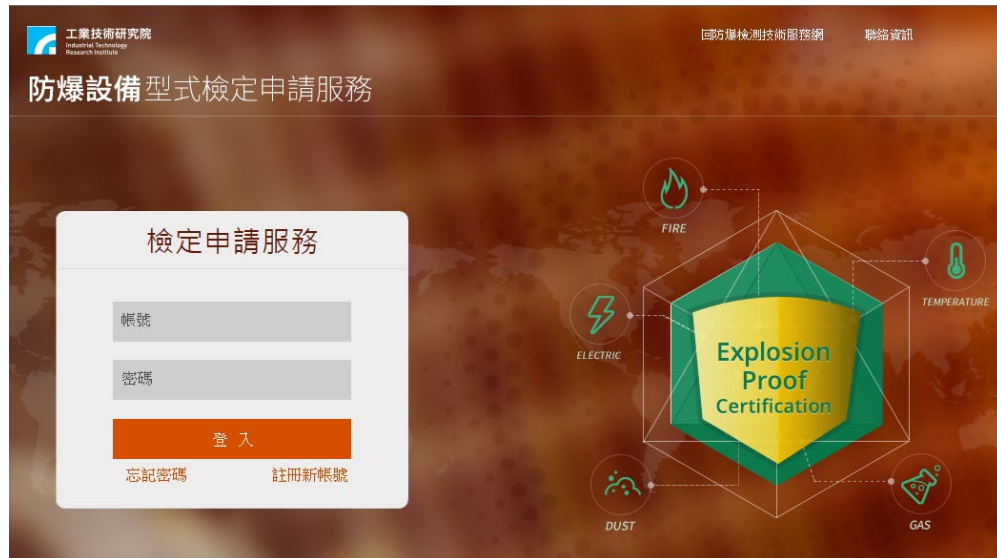
圖 3.2 型式檢定申請服務系統首頁