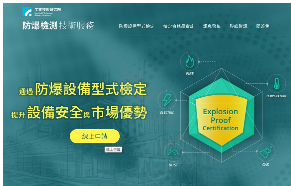
圖 3.1 防爆檢測技術服務網首頁( www.mepeccd.itri.org.tw )

本機構之型式檢定作業 5 採網路電子化方式經辦，申請人應先至本機構「防爆檢測技術服務網( www.mepeccd.itri.org.tw )」首頁，點選「線上申請」(如圖 3.1)後進入「型式檢定申請服務系統」首頁(如圖 3.2，以下簡稱申請系統)。申請系統之操作說明，可於本機構首頁點選「文件下載」瀏覽「網頁操作手冊(新系統)」之相關說明。申請人於初次申請時，應先於申請系統註冊新帳號，待帳號經確認驗證啟用後始可以登入使用。相關申請文件之電子表單與檔案，可於登入申請系統後下載使用。